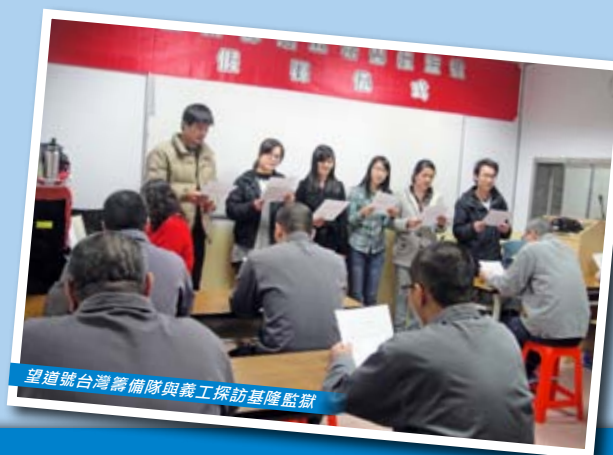
望道號台灣籌備隊與義工探訪基隆監獄

望道號留在香港維修的同時，原本到訪台灣的行程縱然要取消，但台灣籌備隊和義工卻沒有停止服侍。他們照原定計劃去探訪基隆監獄，向囚友分享福音。在30多名囚友中，有8人舉手表示願意接受耶穌為救主！