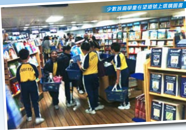
少數族裔兒童在望道號上選購圖書

讓我們一同禱告，願神帶領更多弟兄姊妹不單參與事工、體驗差傳，更是投入委身於神的大使命！