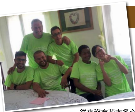
從來沒有花太多心思去明白。

「請差遣我……前面的那位。」這是不少人聽到「短宣」兩個字時的反應，原因可能是「我不足……」、「我不能……」、「我不可以……」。然而，以下兩位姊妹的分享，正正用她們的軟弱，去見證神的大能。