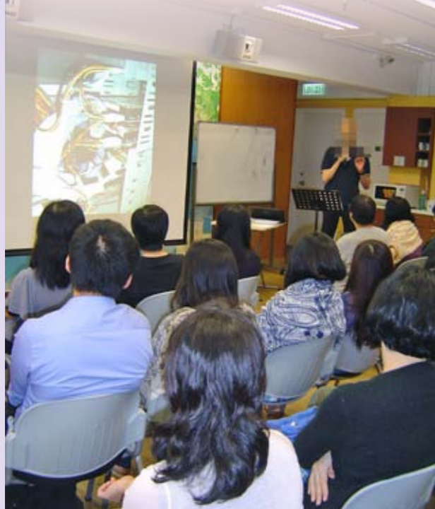
挪亞先生在穆宣萬花筒中分享。

二人懷着差傳的心志，分別在中東地區帶職事奉長達10年。就是兩人的這類差傳心，把本來相距南北半球的兩個人連繫起來。結婚後，他們繼續在中東服侍。