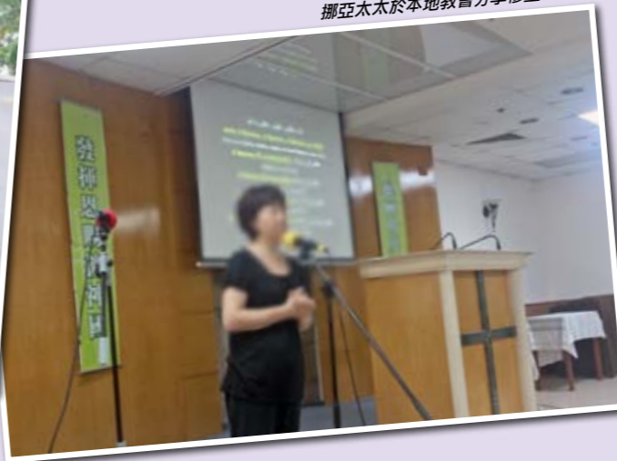
挪亞太太於本地教會分享穆宣工作。

那麼你們事奉的喜樂來源是甚麼？挪亞太太說：「我的喜樂是當我能參與在別人的生命中，跟他們一同作人生的決定，儘管只是其中的一兩步。」挪亞先生則說：「我享受向別人傳授知識和技能，所以我很開心在我工作的地方有一些謙虛好學的實習生。跟她們分享知識是我喜樂的來源。」