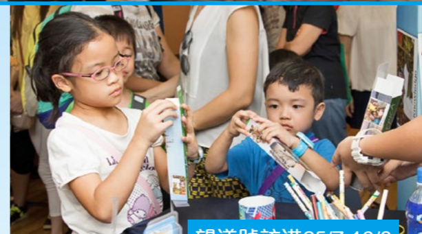
望道號訪港25/7-10/8 10個趣味數字