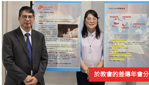
於教會的差傳年會分享