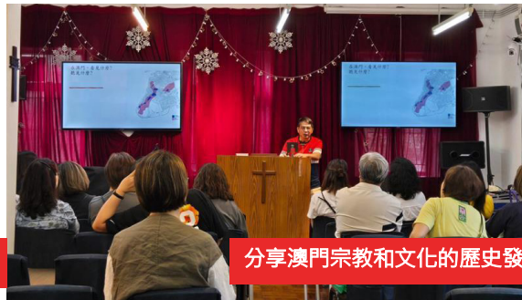
分享澳門宗教和文化的歷史發展