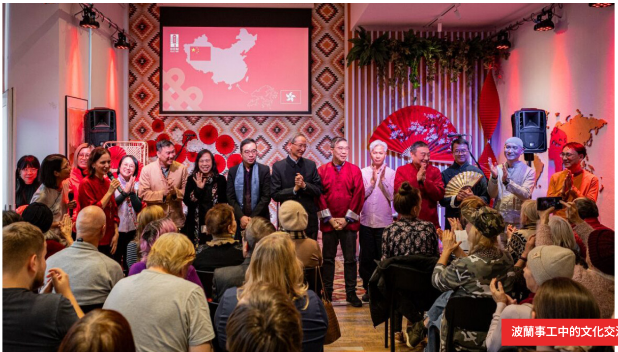
波蘭事工中的文化交流