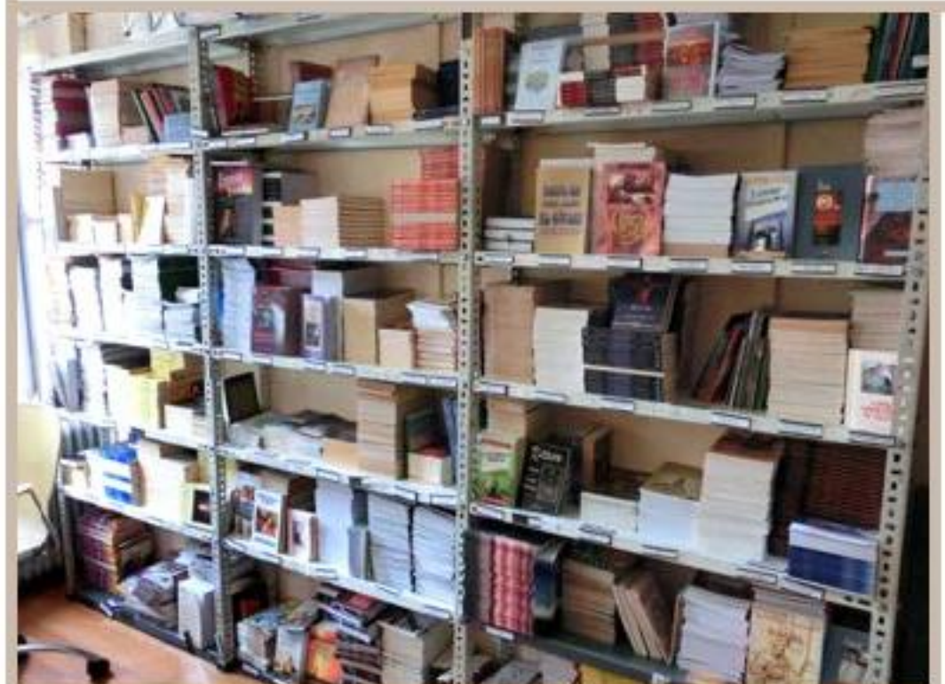
辦公室內的藏書 (沒有被火警影響的樓層)