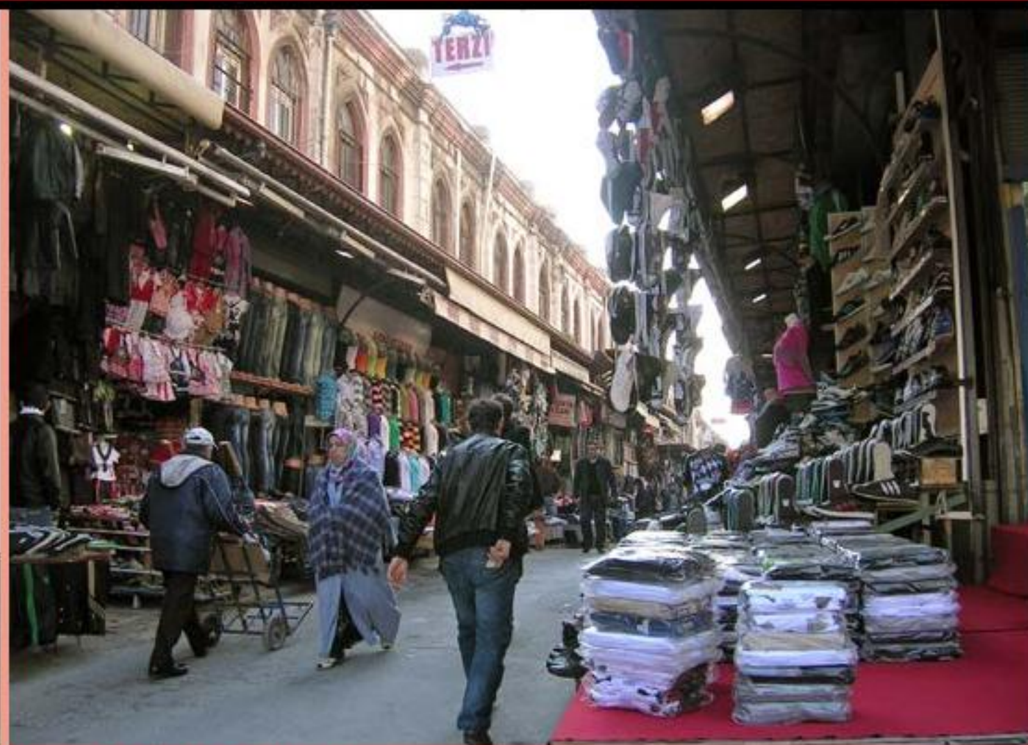
土耳其的市集和商舖。

那是我在土耳其的第二年。在一次巡演中，我是團長助理而非演出者，並負責保管金錢。巡演的第一星期，我在文化衝擊及各種壓力下，晚上站在街頭時，會感到莫名恐懼。其中一晚，當大家演出時，我竟然情緒崩潰，失控地哭泣。感恩有幾位姊妹站到我身邊，為我接手禱告和安慰我。