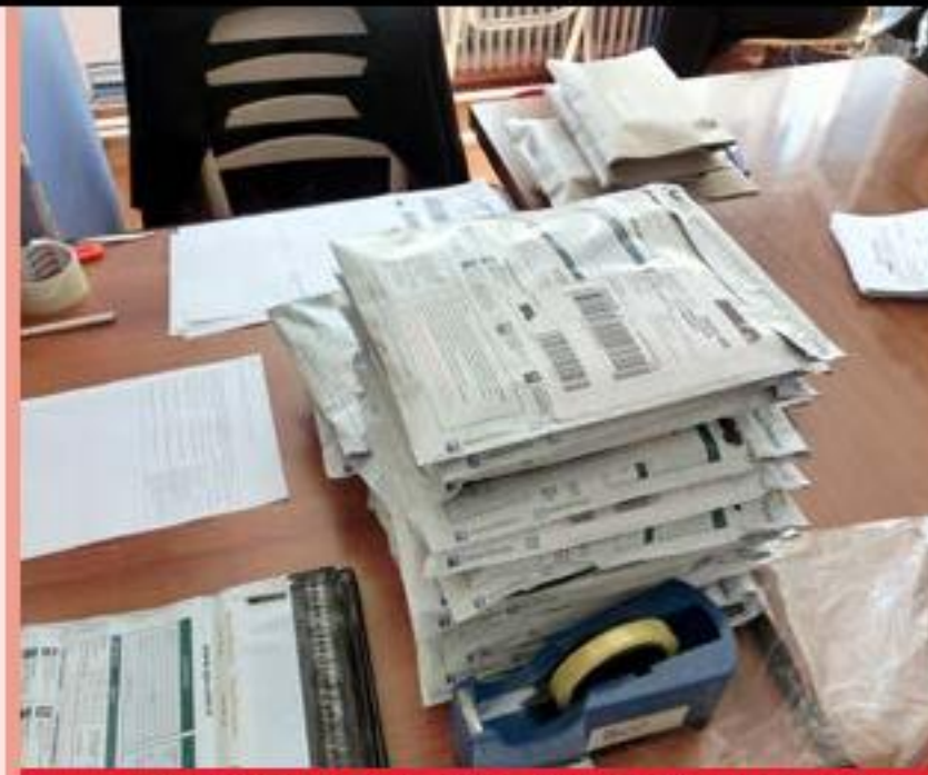
因悦參與了每周一次預備郵包的工作。圖為預備好、待寄的郵包。

2013年暑假，齋戒月的某一天，F先生買了預備晚餐的食物後，在公園遇見一些外國人。為了練習英