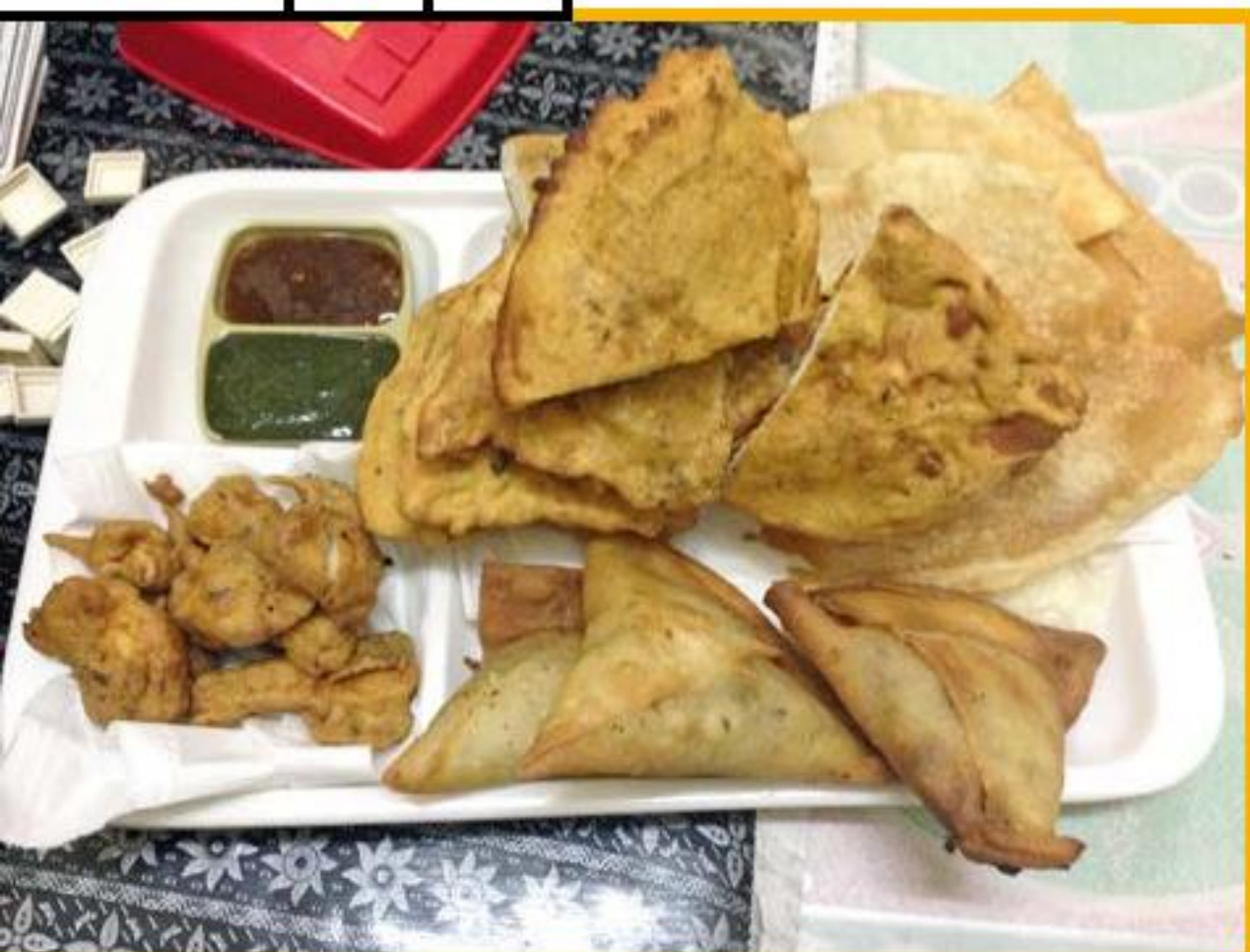
芭拉在探訪時為同工準備的美食。