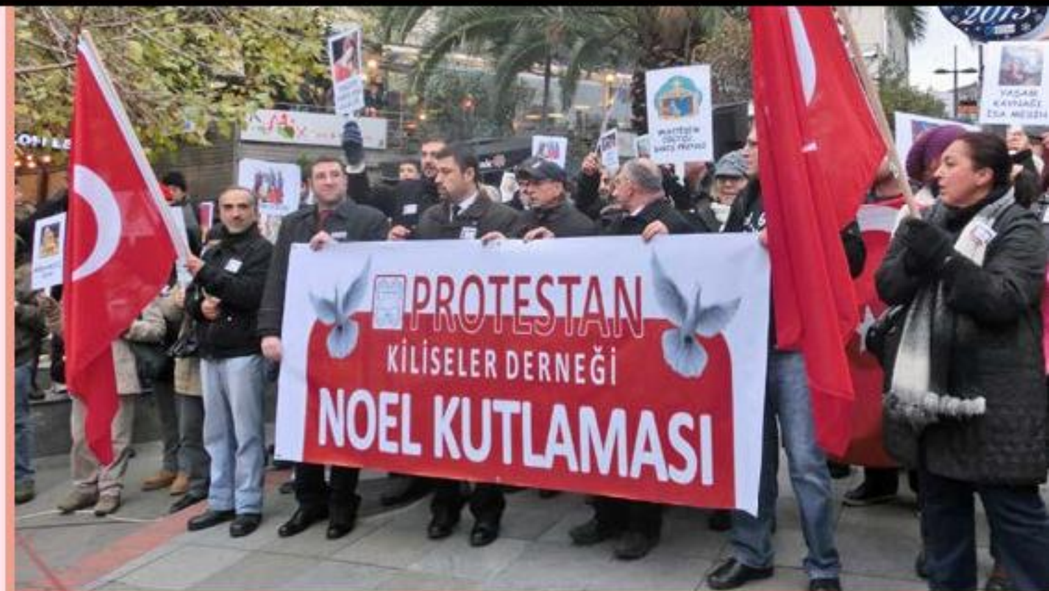
2012年聖誕節，土耳其教會在街道上公開慶祝聖誕節，包括和平遊行、詩班獻唱、信息分享和禱告。有許多本地信徒參，一起帶出平安的信息，並祝福社區。

今天的土耳其，有統計指出，當地已得救信主的基督徒少於六千人。當然，所有統計都不可盡信，真實的數字唯有神知道。我深深希望，真正的得救數字比這更多。不過我想，這「六千」的數字，可以給我們一個思想的空間。在這個總人口是約七千萬的國家裏，福音的需要是何期的大！