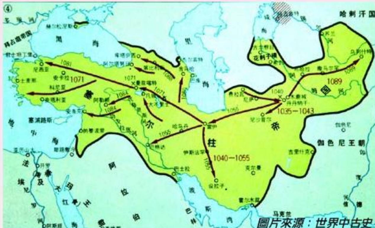
突厥於十一世紀擴展的版圖。

突厥人建立的鄂圖曼土耳其帝國，從中亞擴展到小亞細亞的地區。1453年征服了君士坦丁堡，並定為首都。