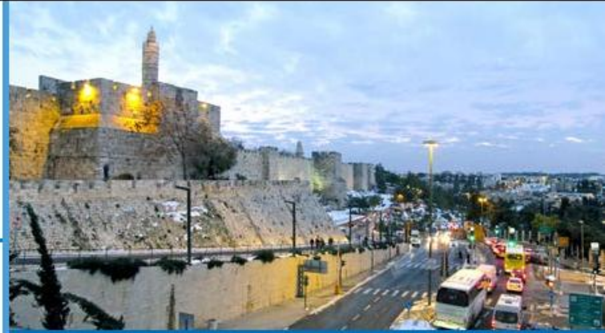
亞米嘉是本會海外差傳同工，過去四年於中東服侍。

在進入應許之地前，主給我的應許經文是：你們必歡歡喜喜而出來，平平安安蒙引導。大山小山必在你們面前歡呼，田野的樹木也都拍掌。松樹長出，代替荊棘；番石榴長出，代替蒺藜。這要為耶和華留名，作為永遠的證據、不能剪除。（賽五十五11-13）