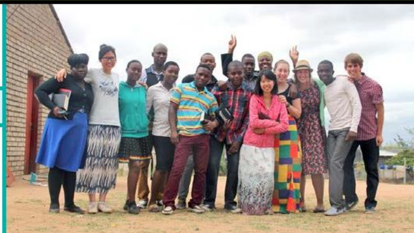
筆者(左二)的隊員來自世界各地。

去年9月我來到南非參加差傳門徒訓練，跟四十多位來自南非、德國、美國、瑞士、韓國、捷克、台灣、馬來西亞、荷蘭、芬蘭、澳洲等地的學員朝夕相對，各人來自不同的文化和背景，卻走在同一條差傳路上，由陌生人漸漸走近成為同路人，這是多麼美的事！