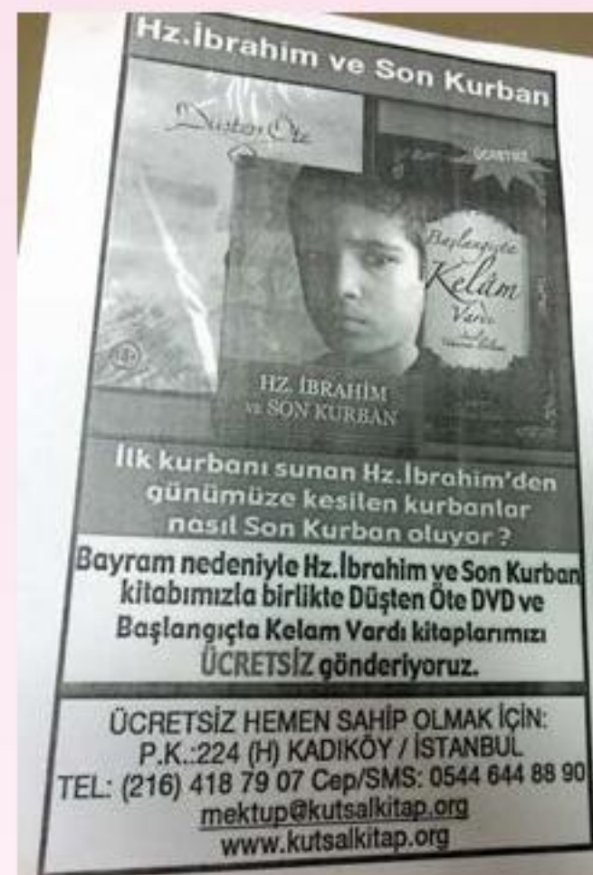
BCC的單張，內容：郵寄或打電話，可免費獲得「先知亞伯拉罕和最後的祭物」小冊子、「夢境尋真」DVD及「太初有道」書本。