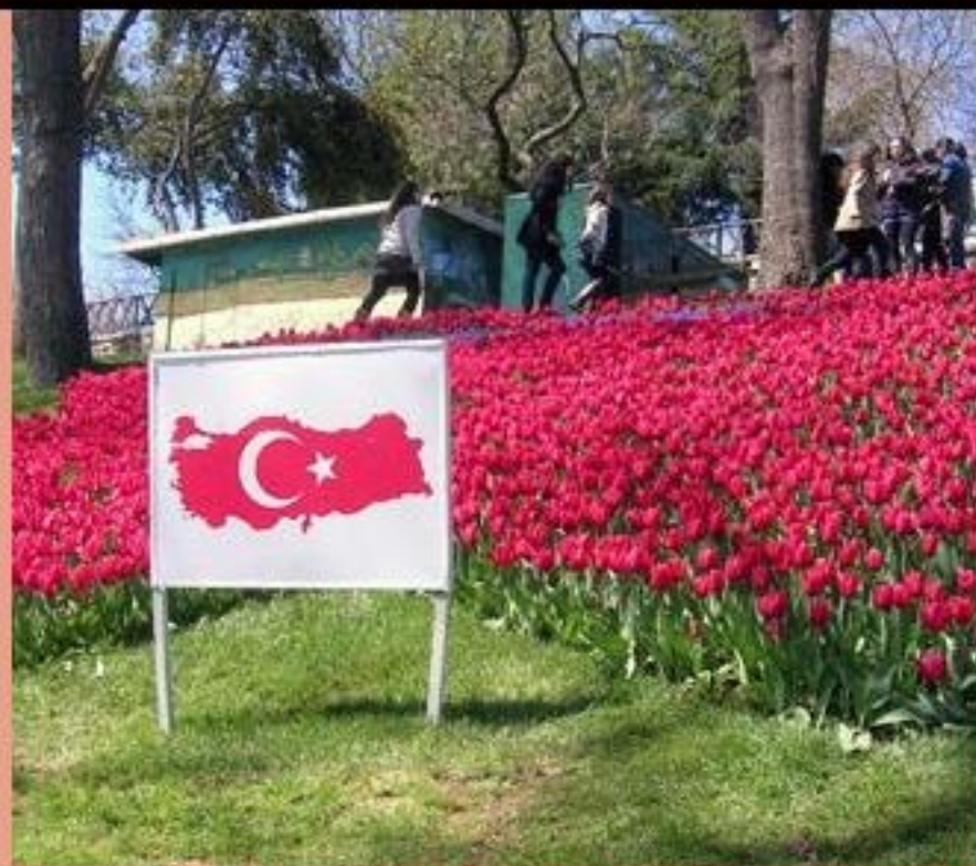
土耳其每年都會有鬱金香花展，相片是攝於花展的公園內。

2010年1月至2014年7月間，神帶領筆者因悅在土耳其事奉。在這四年多裏，因悅參與過不同的事工，包括藝術佈道、鋼琴教師、華人教會和聖經函授課程等。