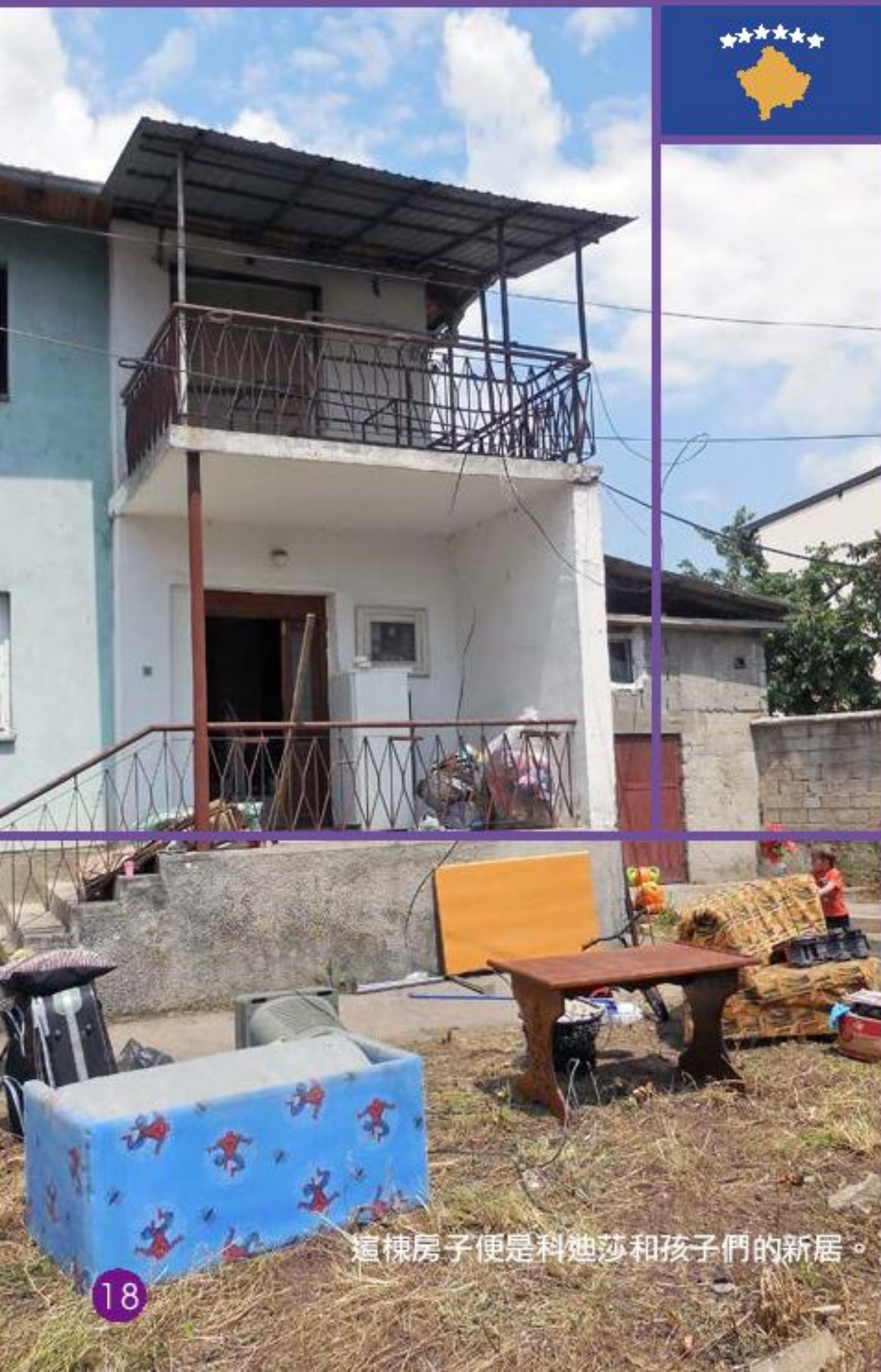
這棟房子便是科迪莎和孩子們的新居。