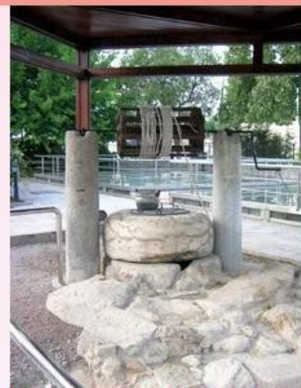
因為大數是保羅的家鄉，所以這口水井也與保羅連上關係，成為旅遊點。