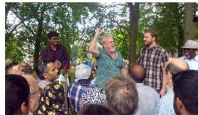
筆者的穆斯林初體驗。

在《蛻變生命》營會的一天靈修中，神再次提醒我，是祂的恩典邀請我參與祂國度的工作。耶穌餵飽四千人的神蹟中，耶穌其實大可直接將餅分給羣眾，但祂選擇遞給門徒，叫他們把餅傳開。祂讓門徒參與在這神蹟中，讓他們有分，定意讓門徒沾上一點祂的榮耀。同樣，在二千多年後的今日，神讓我參與在祂神國拓展的工作中，更藉這段經文再次肯定及鼓勵我。